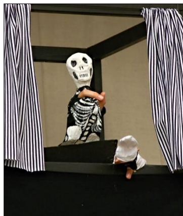
„Pulcinella a pulcino“ „Nesmrtelný Pulcinella“ (Theatrum Kuks)

Pět členek ze souboru se zúčastnilo oblastní kola přehlídky individuálních výstupů s loutkou s výstupy