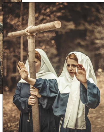
Rej čarodějnic v Betlémě v Kuksu