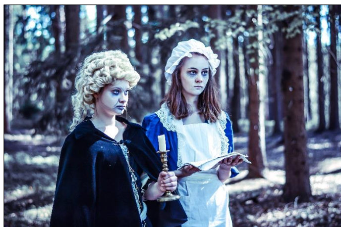
Rej čarodějnic v Betlémě u Kuksu