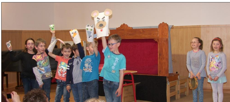
„Domeček“ (Předváděčka dramaťáku)

Nejmladší děti z přípravného studia se pochlubily svou prací na Vánočním koncertě dramatisací básničky „Copak sluníčko?“ a na Předváděčce dramaťáku pohádkou „Domeček“.