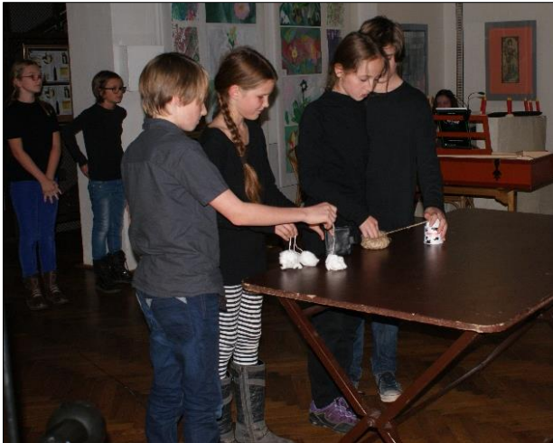
Convivium v Praze (finále projektu Čtenář na jevišti)

„Jak stařeček měnil, až vyměnil“ (Naše úroda)