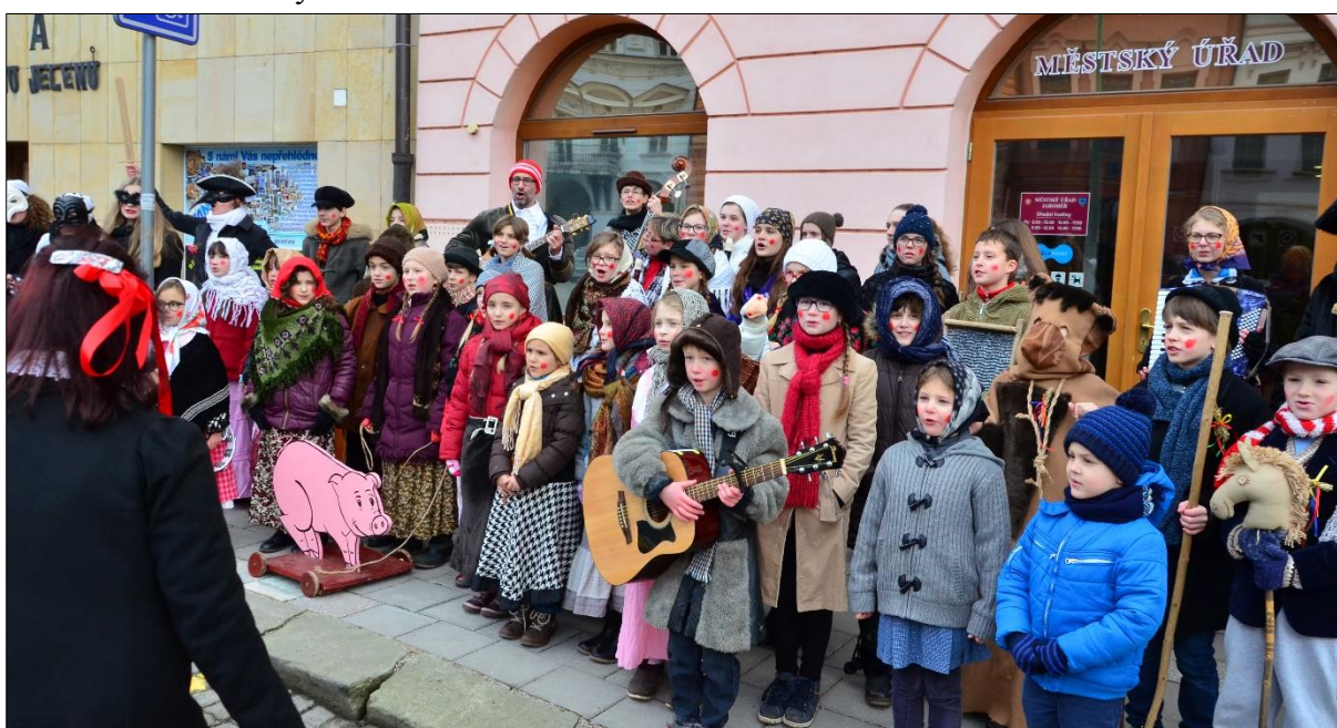
Masopustní průvod v Jaroměři

Žáci všech skupin pravidelně účinkují v Masopustním průvodu v Jaroměři a potom v masopustním programu v Domově sv. Josefa v Žirči, moderují akce školy (koncerty, Šporkovská akademie ZUŠ) a na konci dubna ti nejstarší už podruhé účinkovali v komponované akci Rej čarodějnic v Betlémě u Kuksu. Literárně dramatický obor se velkou měrou podílí na vydávání školního měsíčníku ZUŠkoviny.