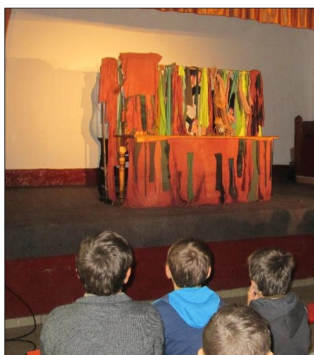
na Svaté Heleně