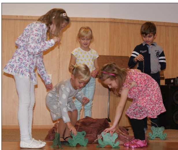
„Žáby“ (Naše úrodička)

Nejmladší děti z dramatické Přípravky vystoupily na podzimním koncertě Naše úrodička s pásmem lidové poezie „Žáby“, na Předváděčce dramatařů zahrály vlastní adaptaci textů „Mraveneček v lese“ a přednášely i na koncertu ke Dni matek.