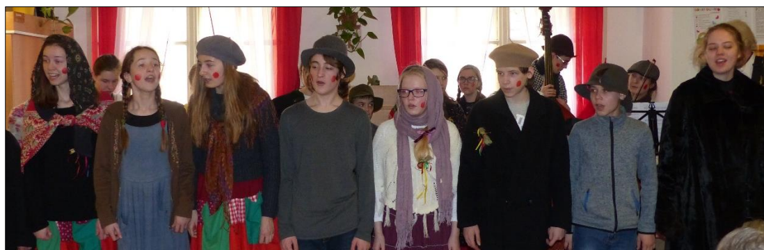
Masopustní ohlédnutí v Domově sv. Josefa v Žirči