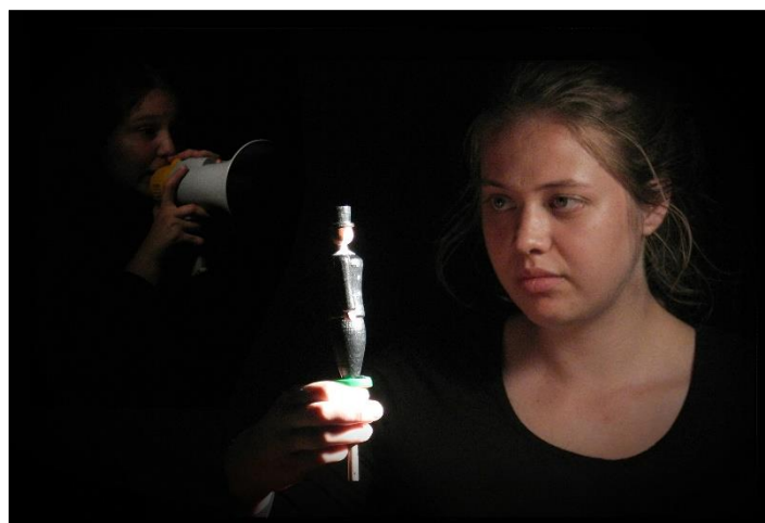
soubor JAKKdo: „Musí to být“