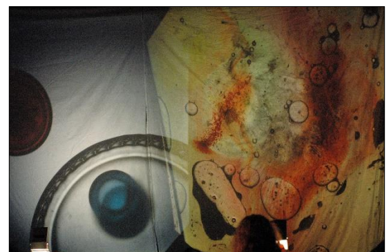
soubor Mikrle: „Štípnutí labutě“