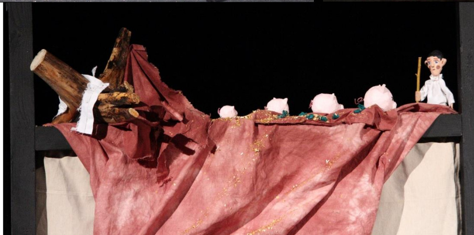
soubor Convivium: „Otesánek“

Soubor Malé dvě dokončil inscenaci podle pohádky Václava Říhy „Ubrousku, prostři se!“ V krajském kole loutkářské přehlídky byl oceněn za scénografii a doporučen na Loutkářskou Chrudim. Inscenace se po rozhodnutí programové rady v hlavním programu Loutkářské Chrudimi hrála.