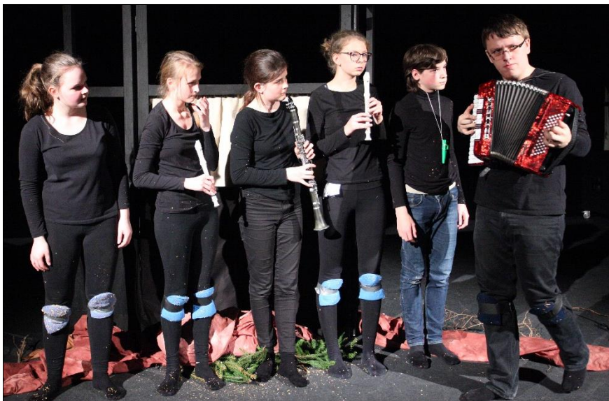
Drak v Hradci Králové.