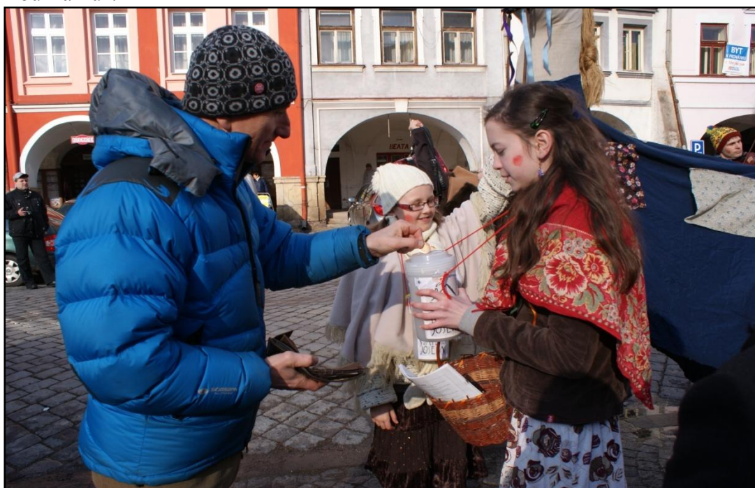
Během Masopustního průvodu žáci shromažďují finanční příspěvky pro Domov sv. Josefa V Žirči