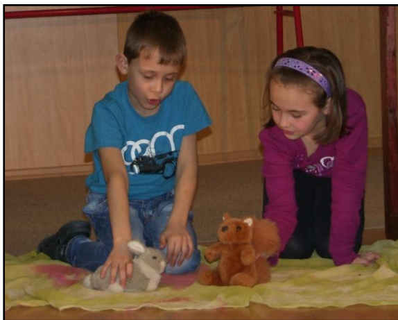
Jáciček a Veverka (Haló, Jácičku!)

Nejmenší děti z přípravy vystoupily tradičně na koncertě Naše úrodička s pásmem lidové poesie pod názvem „Dědci a babky“ a potom se věnovaly knížce D. Mrázkové „Haló, Jácičku“. Stejně se jmenovalo jejich vystoupení na Předváděčce dramataku a na koncertě ke Dni matek.