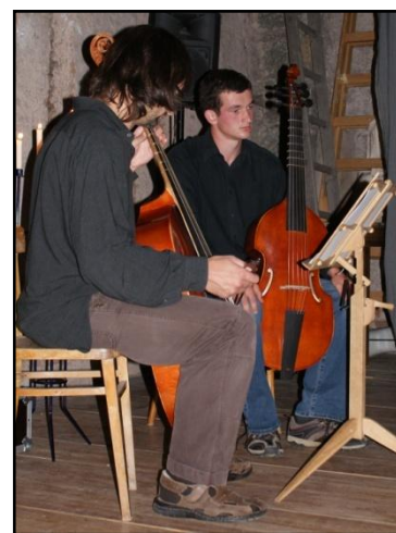
Soubor Děvčátko a slečny a F:A:G:V:S : Kázání děvčátkům a slečnám