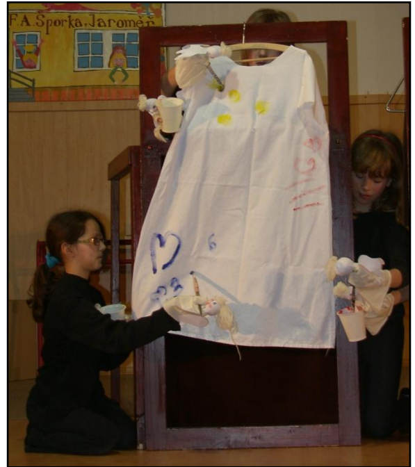
O pyšné noční košilce