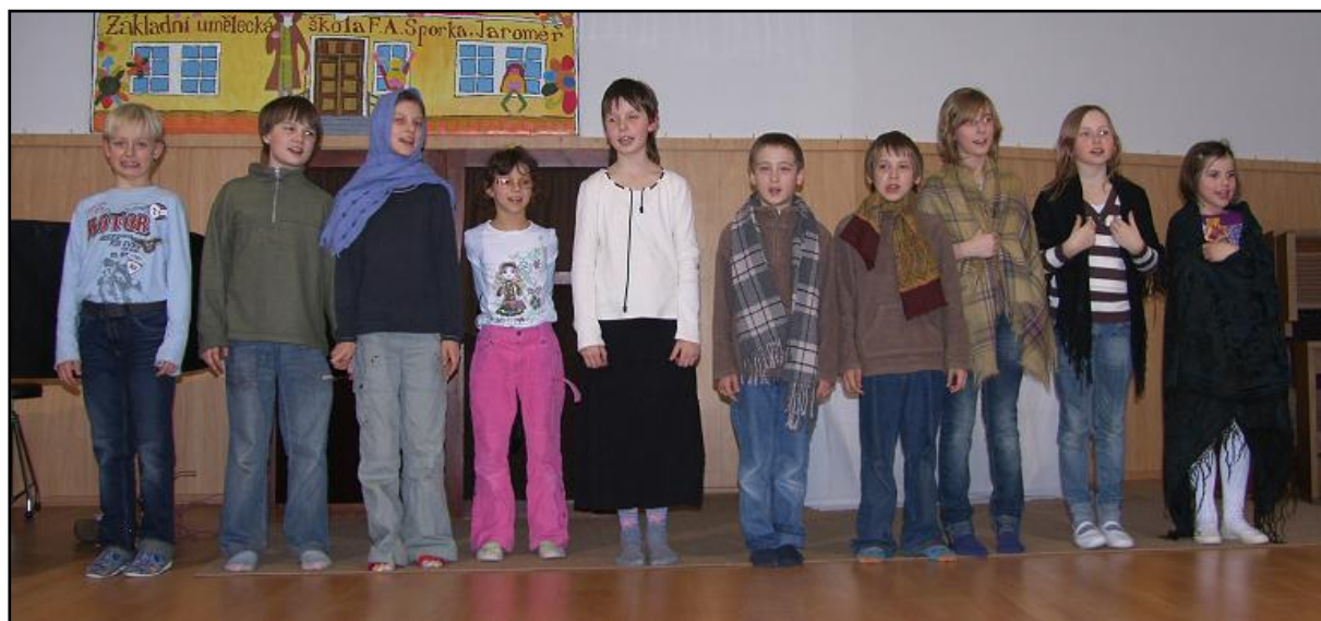
Děkovačka při Předváděčce dramaťáku (1. a 2. ročník)

1. a 2. ročník pokračoval kratšími inscenacemi, jako byla pohádka „O veliké řepě“, kterou děti hrály prstovými loutkami na Naší úrodičce a příběh „Stojí vrba“ společně s Pastýřskou hrou „Hej hej, povím vám!“ na Černé adventní hodině, na Vánočním trhu v Jaroměři, vánočním vystoupení v Domě s pečovatelskou službou a Vánočním koncertě v ZUŠ. Žáci účinkovali také v Masopustním průvodu v Jaroměři, ve Velichovkách a v Domově sv. Josefa v Žirči. Své masopustní scénky předvedli pro rodiče na Předváděčce dramaťáku a pro maminky připravili „Příběhy z kuchyně“, ve kterých v krátkých etudách animovali předměty.