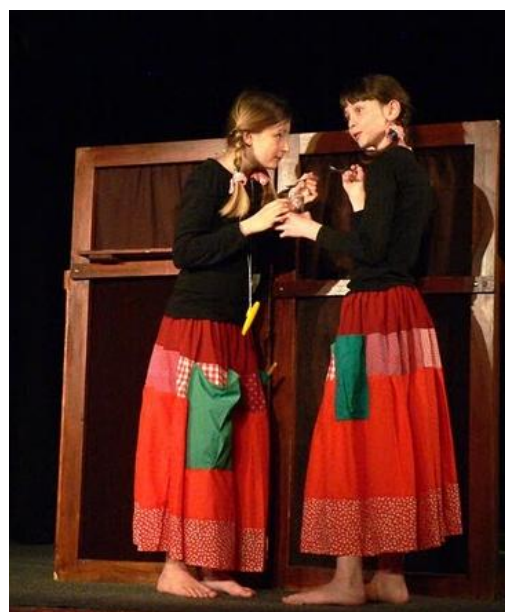
„Pohádka o veliké řepě“ (Malé dvě)