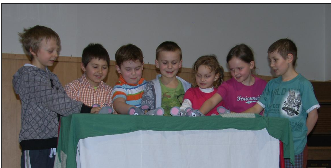
„Táto, mámo, v komoře je myš!“ (PDV)

Nejmladší žáci z Přípravné dramatické výchovy se tradičně zabývali dramatizacemi jednoduchých umělých i lidových textů, se kterými vystoupili na některých celoškolních koncertech. Na Naší úrodičce předvedli loutkovou dramatizaci „Žížaly“ a Švestky“, na Černé adventní hodině vystoupili s voicebandem předvánočních pranostik a na Předváděčce dramaťáku ukázali základní loutkářskou práci v krátké inscenaci „Táto mámo, v komoře je myš!“ Na koncertě ke Dni matek maminkám popřáli pásmem poesie.