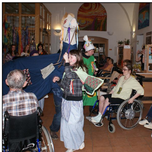
Masopust v Jaroměři a v Žirči

V lednu se i nejmladší žáci účastnili výletu do hradeckého loutkového divadla Drak, kde shlédli představení „Červená Karkulka v laboratoři“ a zároveň se zúčastnili projektu ve výstavních prostorách Labyrintu.