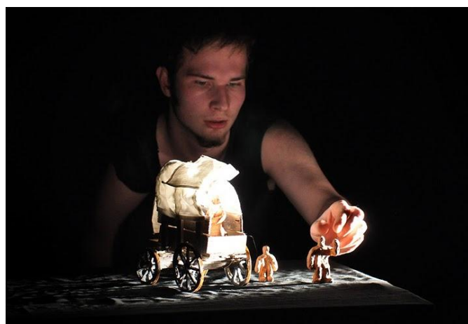
Darrell Standing“ (Někdo)

Nejstarší žáci vystoupili s ukázkou z dětské opery Brundibár v září v Německém Dortmundu. Celý komponovaný pořad byl uveden potom v Jaroměři a v Náchodě. Žáci byli úspěšní i v přehlídce sólových recitátorů, z okresního kola postoupili do kola krajského nebo získali