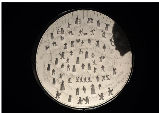
„Labyrint podle Jana“ (Labyrint)

Došlo ke spojení Mojí pětky se zbývajícimi členy Spolu, ale každý sám a pod názvem Labyrint soubor připravoval novou verzi inscenace „Labyrint podle Jana“ J. A. Komenského. Tato inscenace byla z krajského kola Audimaforu doporučena na Wolkrův Prostějov a hrála se na Loutkářské Chrudimi. Byla dobře přijata i v Brandýse nad Orlicí, kam byla pozvána do závěrečného programu soutěže Comenius.