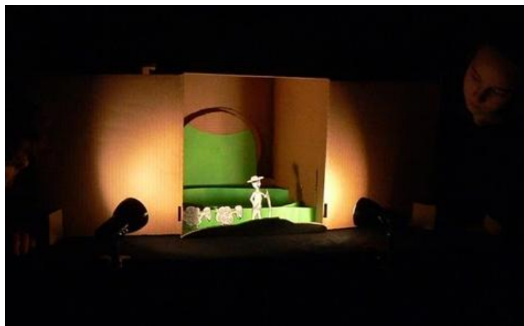
„O pasáčkovi“ (soubor Sinice)

Další dramatizace, se kterými žáci vystupovali na koncertech školy a na Předváděčce dramatařů: „Jak to přišlo, že svět světem stojí“ a „Desatero šlo“ (kolektivní dramatizace lidových textů), „Kuřátko a obilí“ (malé loutkové divadélko na stole) „Cirkus“ (vlastnoručně vyrobení manekýni vodění rukou a později čempuritami) a „Jak se Kuba ztratil“.