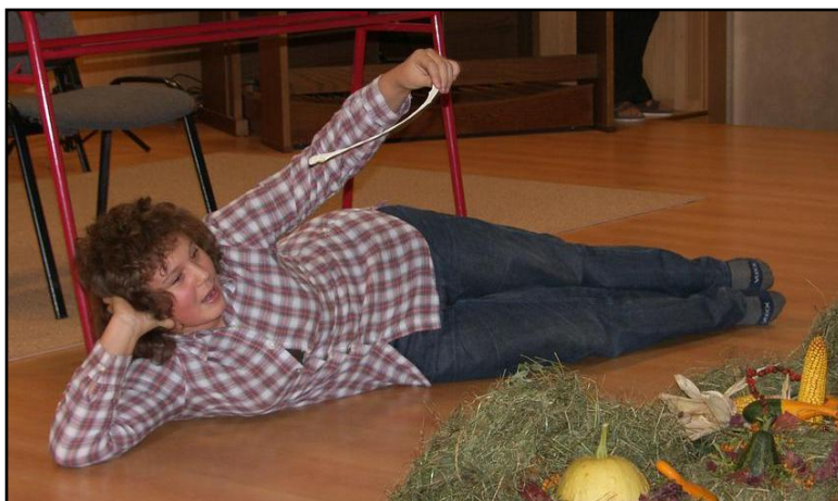
Limeriky Edwarda Leara a Jiřího Žáčka