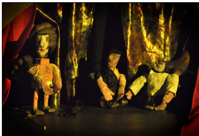
„Káli, namó namá“

Soubor pracoval na nové inscenaci inspirované povídkou Thomase Manna „Zaměněné hlavy“ a uvedl ji pod názvem „Káli, namó namá“ na přehlídce Audimafor a na Regionální loutkářské přehlídce, kde získal Cenu za působivé ztvárnění příběhu z indické mytologie.