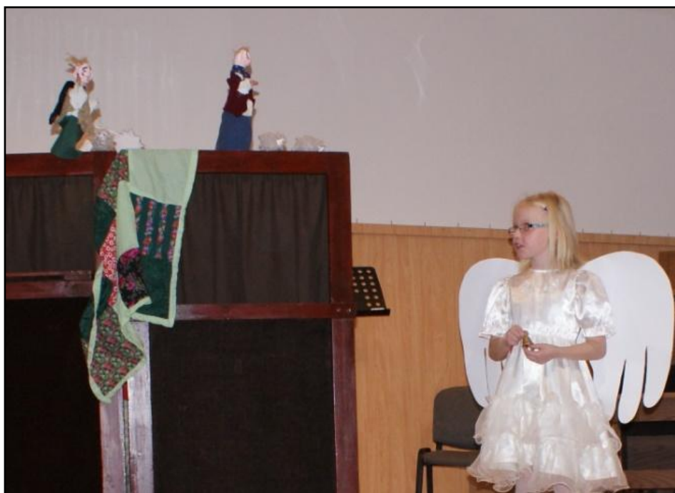
„Houfem, ovečky“ (1. a 2. ročník)