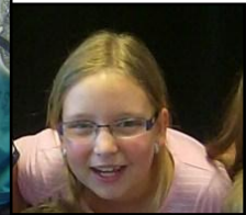
1. a 2. ročník