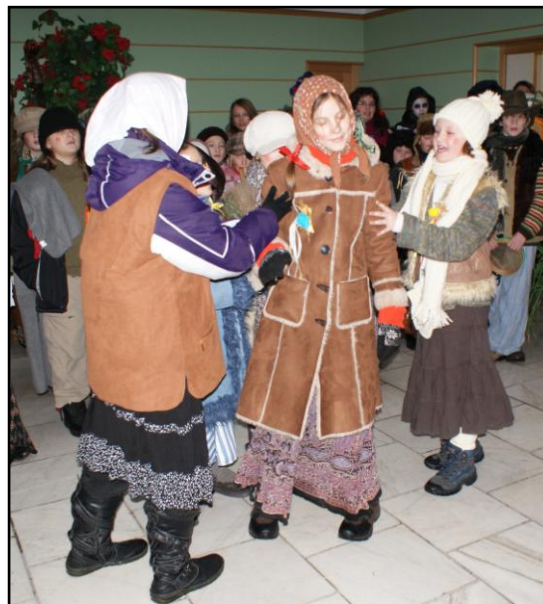
„Malé dvě a ostatní“ na Masopustu