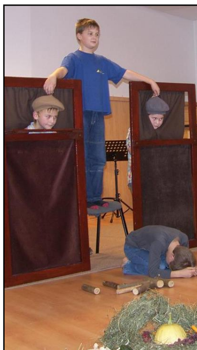
„Sluníčko zachází za hory...“

1. a 2. ročník se tradičně věnoval práci s lidovou poezií. Dramatizaci „Sluníčko zachází za hory“ předvedli žáci na koncertě Naše úroda, s vánočním představením „Houfem ovečky“ účinkovali na Černé adventní hodince, v Domě s pečovatelskou službou v Jaroměři a na Vánočním koncertě pro Klub seniorů.