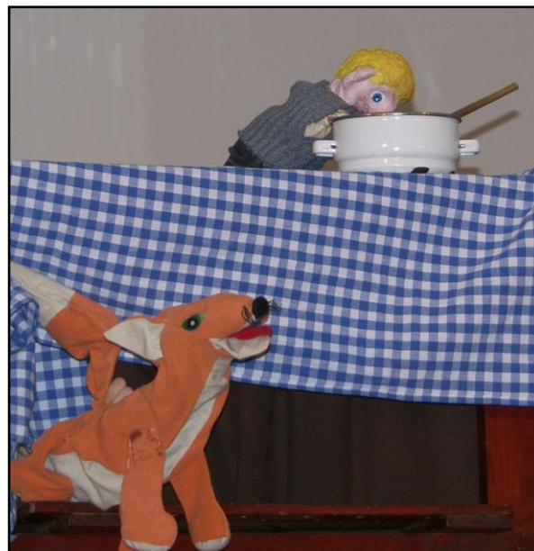
„O Budulínkovi“ (1. a 2. ročník)

Od 3. do 6. ročníku I. cyklu tvoří žáci samostatné soubory a pracují v nich na „větších“ inscenacích. Loňský soubor Malé dvě zahrál „Pohádku o veliké řepě“ na Jaroměřském loutkářeni a v Praze v Divadle v Celetné ulici na Přehlídce ke Světovému dni divadla pro děti a mládež. Nový soubor Malé dvě a ostatní upravil dvě lidové pohádky o myších a „ponožkovými“ loutkami vytvořil inscenaci „Táto, mámo, v komoře je myš!“, kterou soubor zahrál na Předváděčce a na krajské Regionální loutkářské přehlídce a Dětské scéně.