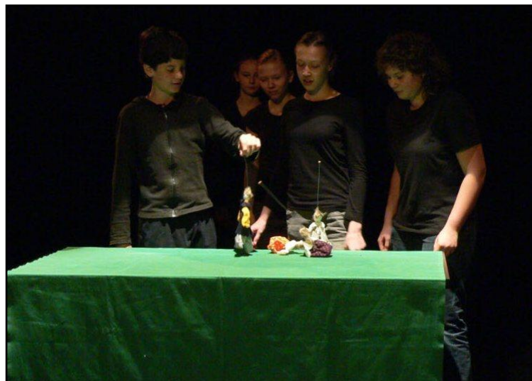
„Divné jméno“ (soubor ...ještě pořád ne!)

Všechny čtyři inscenace mladších souborů získaly od lektorského sboru Čtyři docela velká ocenění za herecké dovednosti v Čtyřech docela mrňavých drobníčkách.