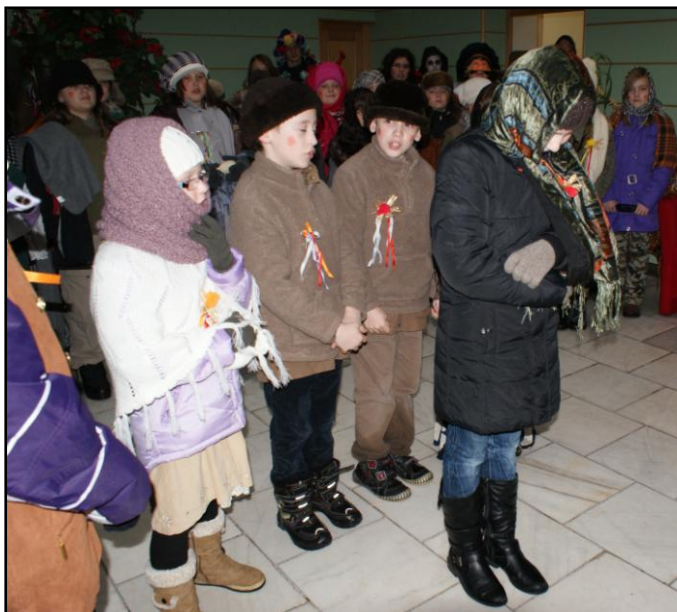
„Šla by baba k muzice...“ (Masopust – na MěÚ)

V únoru vystoupili v rámci Masopustu v Jaroměři, ve Velichovkách a v Domově sv. Josefa v Žirči. Na Předváděčce měla premiéru maňásková pohádka „O Budulínkovi“, kterou zahráli i v rámci programu Dopoledne pro MŠ.