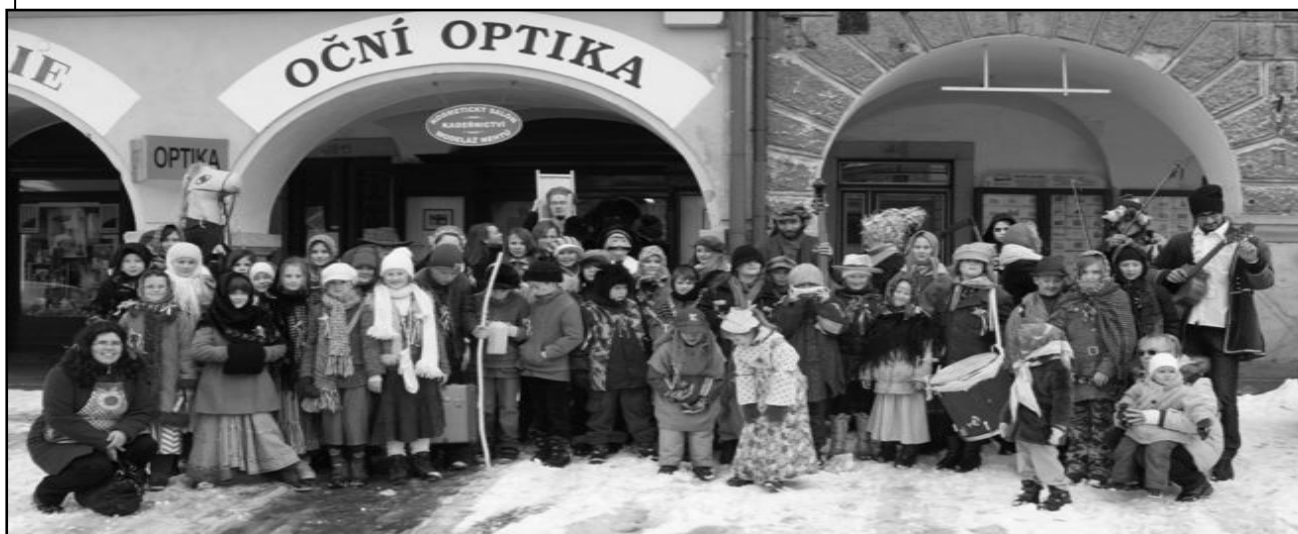
z loňského Masopustního průvodu v Jaroměři