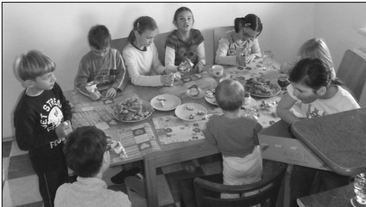
zdobení perníčků pro návštěvníky Vánočního koncertu

Leden ve škole proběhl tradičně, ve znamení třídních koncertů, ale i přípravy na soutěže ZUŠ a těšení se na Masopust.