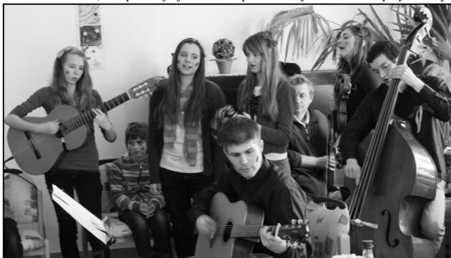
The Ribbons při Masopustním vystoupení v Domově sv. Josefa v Žirči