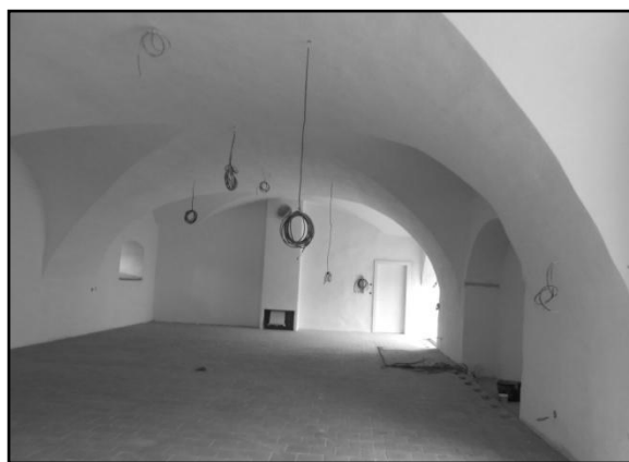
nádvoří Hospitalu, pohled na prostory, které budeme užívat k výuce