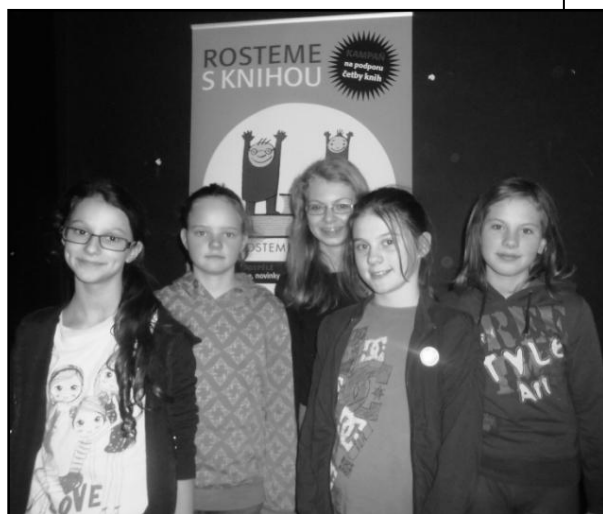
...jak soubor Moje holky rostl s knihou...