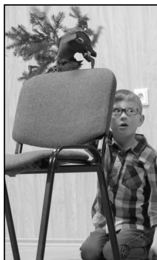
...vlkvy Vánoce... a diváky na Vánočním koncertě.