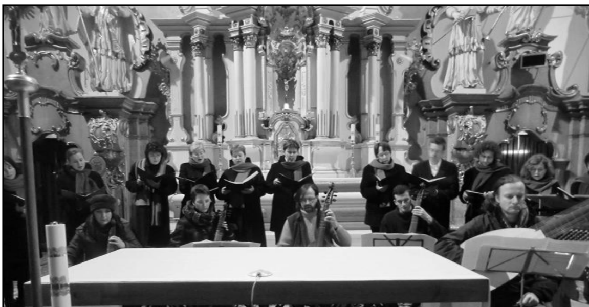
Komorní smíšený sbor Krkonošské Collegium Musicum a Consortvts F:A:G:V:S: