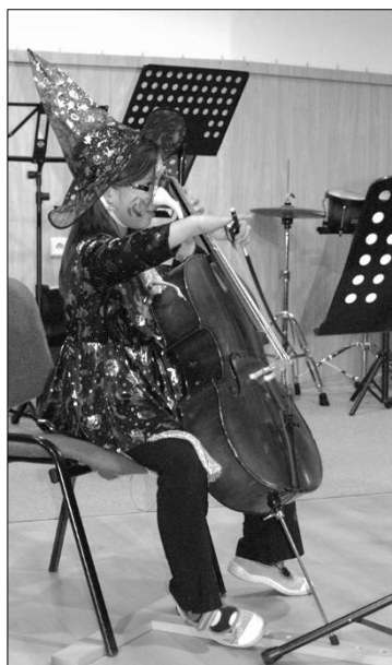
Čaromuzikanti na svém třetím