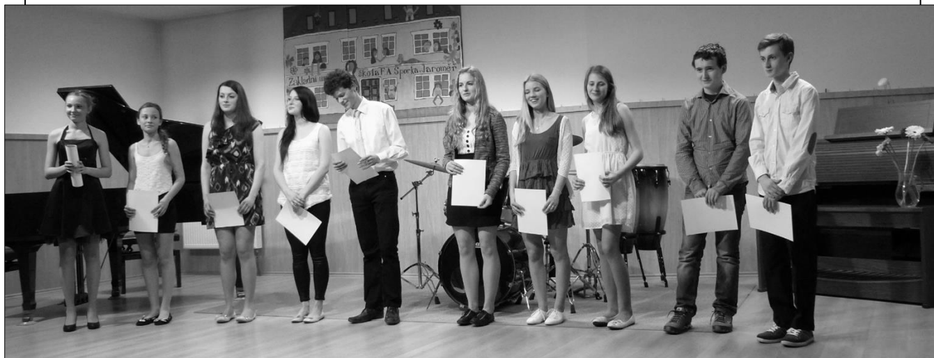
Polovina letošních absolventů hudebního a výtvarného oboru

Šmolíčka, Císařovy nové šaty a Jarčinu pohádku Hrnečku vař! pozval do programu pravidelných pohádek pan knihovník do Obecního domu, v neděli odpoledne 19. dubna. Po našem příjezdu na náměstí městyse nás osobně přivítal a hned nám nabízel občerstvení, které pro nás připravili. My jsme se však nejdříve pustili do příprav na naše představení. Přišlo hodně dětí. A ty se také zapojovaly do představení. Šmolíčkovi ukradly klec, jezinkám chtěly vzít nůž, aktivně sbíraly spadlé šišky a všichni chtěli pomoci Jarce s prokousáváním kaše. Jen co jsme odehráli, vrhli jsme se na výborné koláče, štrůdly a chlebičky. Bylo to příjemně strávené nedělní odpoledne.