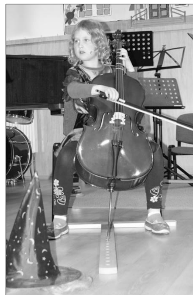
a smyčkovouzelníci historickém sletu