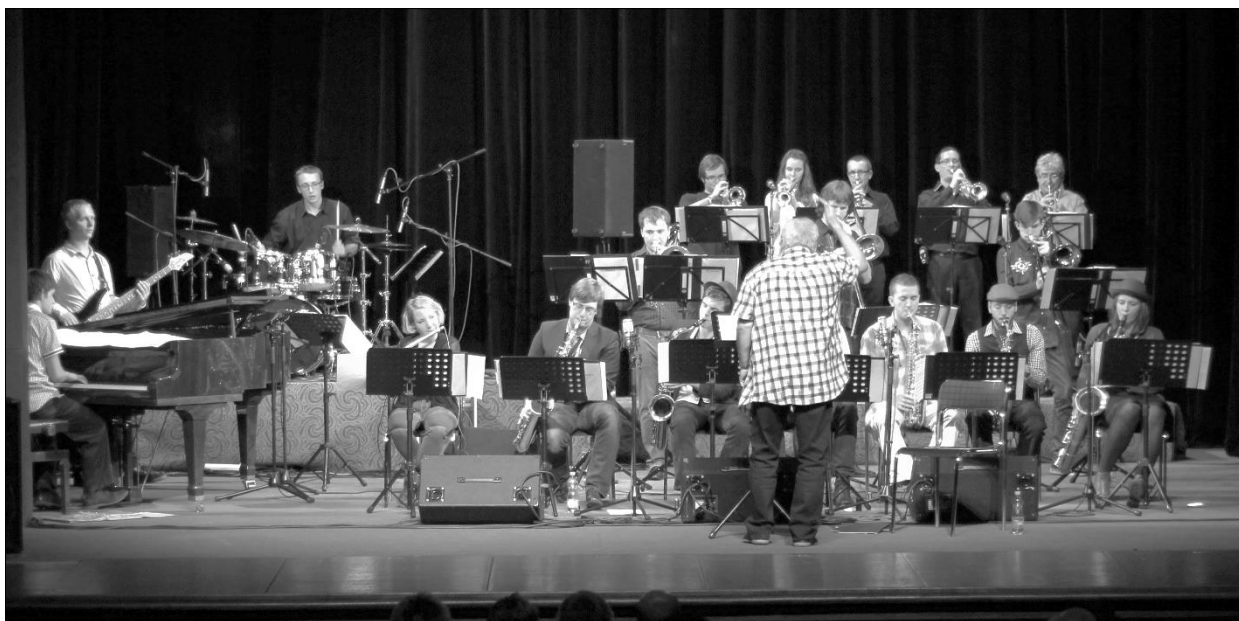
Big Band hraběte Šporka, Jazzoměň 2015