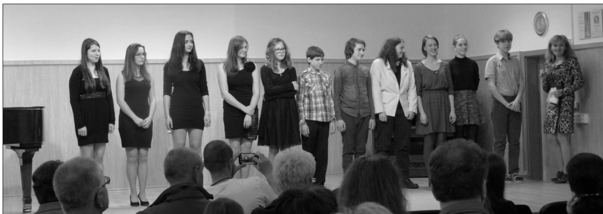
... letošní absolventy na 1. Absolventském koncertě...