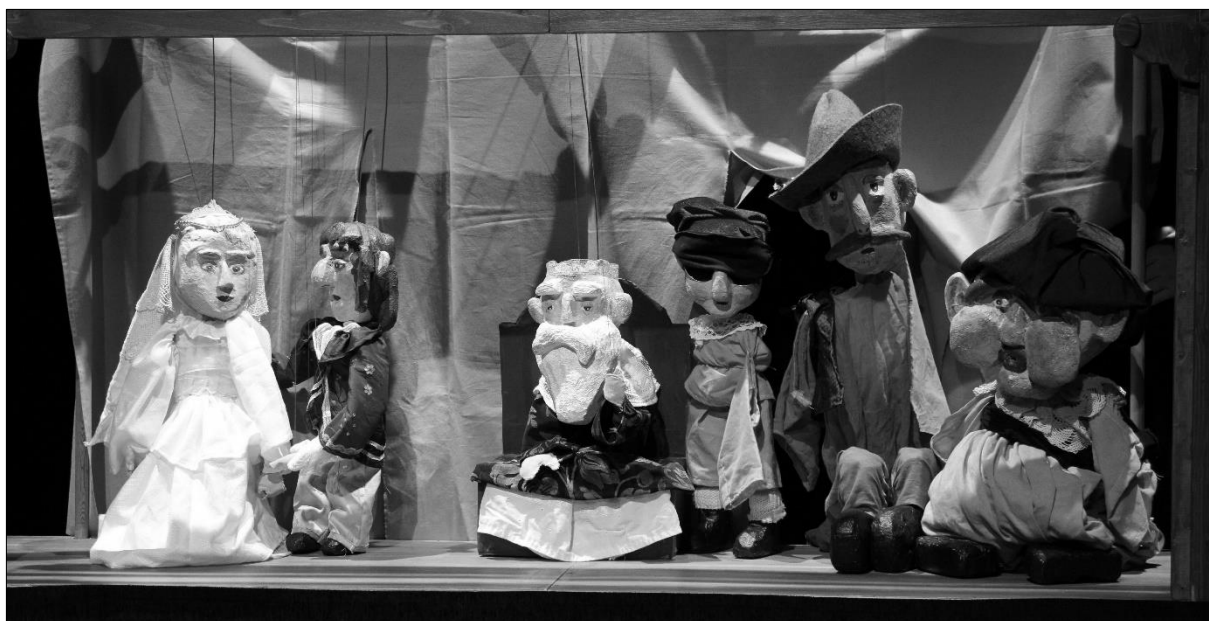
... „Dlouhého, Širokého a Bystrozrakého“ na krajské Dětské scéně a loutkářské přehlídce v divadle Drak.