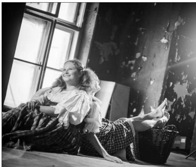
... „Ušubranou“ na Špitál Artu v bývalém kinosálu bývalé vojenské nemocnice v Josefově