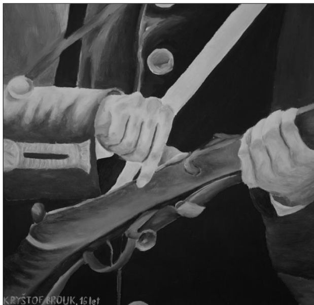
autor: Kryštof Brouk (laureát)