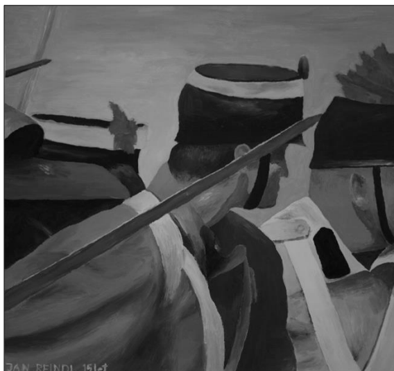
...Bitvy, souboje, zápasy v Informačním centru v Hradci Králové, autor práce: Jan Reindl