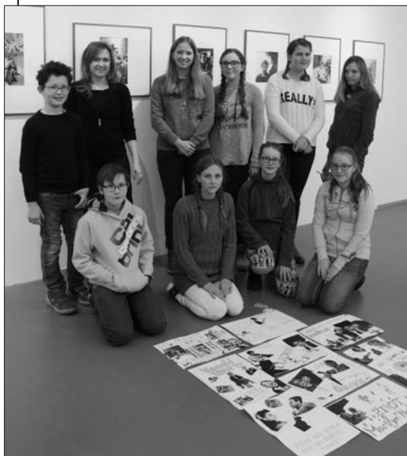
výtvarníky v Domě fotografie v Praze