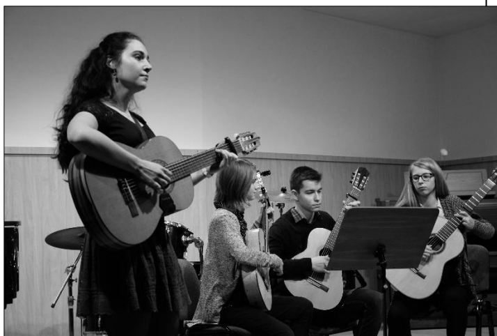
...kytaristy na Prvním vánočním koncertě...