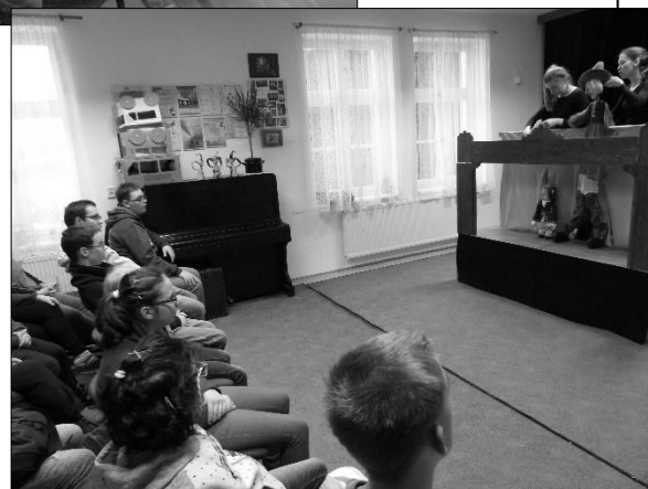
...žáci ze ZŠ speciální v koncertním sále, výtvarně a v dramaťáku.