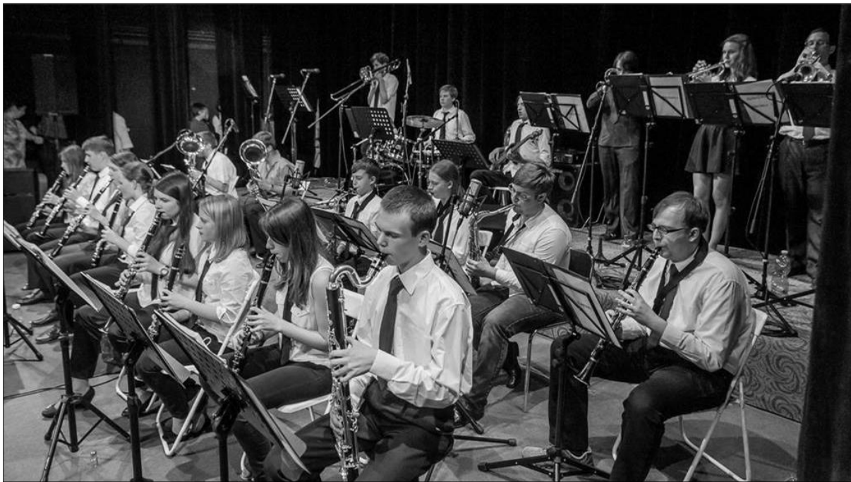
Brass Orchestra na loňské Šporkovské akademii (aktuální fotografie najdete na www.zus-jaromer.cz )

„Povím vám, proč mám rád dechovou hudbu a proč jsem jí oddaně sloužil – protože jejím základem je dech. Bez dechu není života, dech je tvořivá síla. Naši dědové a otcové to věděli, a kdo to chce dnes popírat, je sám proti sobě.“