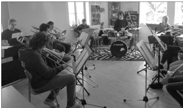
sobotní zkouška v učebně výtvarného oboru

Ve středu 15. března jsme se vypravili do Hradce Králové, konkrétně do Aldisu, kde se konala soutěž jazzových a tanečních orchestrů. Od ZUŠky jsme vyjeli už po 9. hodině. Dopoledne jsme poslouchali ostatní bandy a ještě pilovali, co bylo potřeba. A odpoledne jsme vystoupili my. Umístili jsme se na 3. místě, k čemuž bych přihlížela jako k úspěchu, protože tento band vznikl dva měsíce před soutěží a hlavním cílem bylo hlavně získat motivaci než vyhrát. V bandu můžete slyšet trubky, trombony, saxofon, bicí, klávesy, basu a kytaru. Všichni jsme si pěkně zahráli. Domů jsme přijeli před šestou hodinou, vyčerpaní, unavení, ale spokojení z toho, že jsme mohli své nástroje provětrat! čaBMa