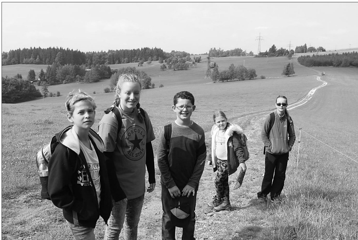
...žáky výtvarného oboru na Kuksu...