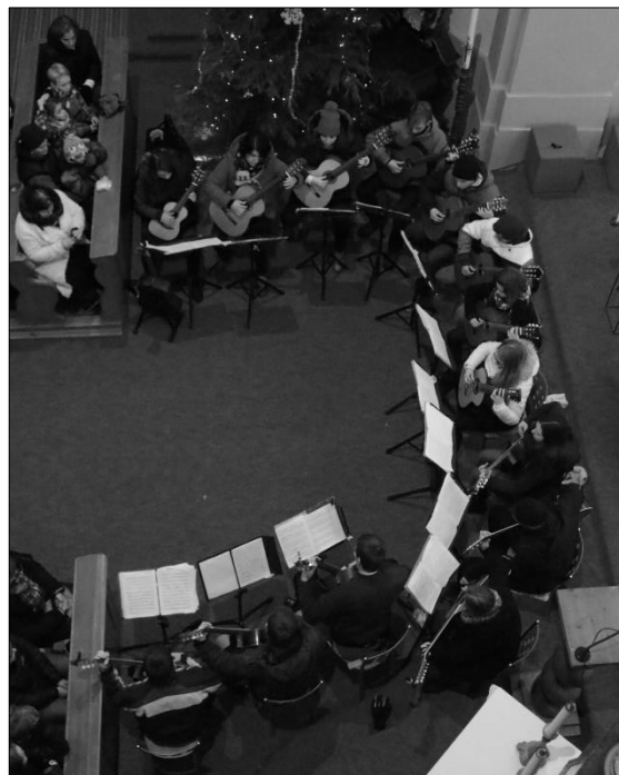
...a Kytarový betlém Matyáše Brauna ve Vysokém nad Jizerou...