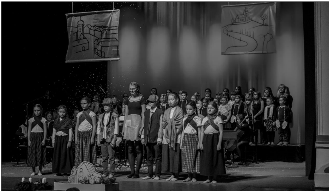
České Vánoce (závěrečné vinšování)

„Že nedostanete vždy, co chcete, je někdy obrovské štěstí.“ (Dalajláma)