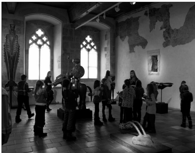
...výtvarníky na výletě v Praze...