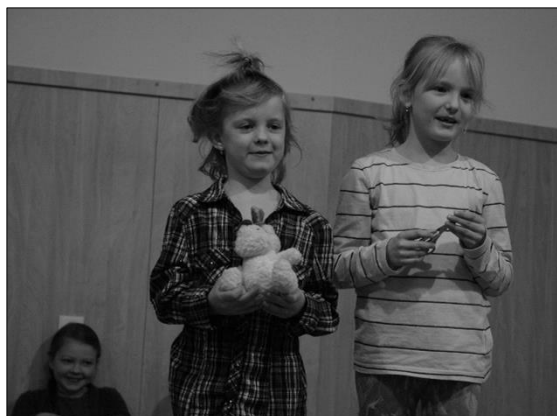
Máte taky pejska?