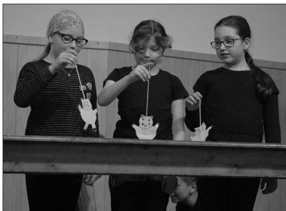
O třech prasátkách