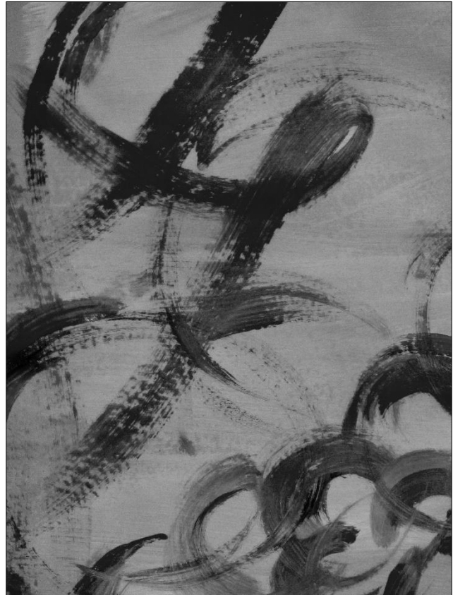
část malby, která vznikla jako improvizace při Absolventském koncertě

Jméno června je odvozováno rozmanitě, někteří viděli jeho původ v červenání ovoce a jahod anebo odvozovali slovo od červenosti vůbec nebo od červů, kteří v tomto období dělají škody zvláště na štěpech a ovoci. Jiní odvozují jméno měsíce od sbírání červce, hmyzu, ze kteréhož se vyrábělo barvivo. Červen je desátým měsícem školního roku, a to nás nyní zajímá nejvíc. Ještě chvíli vydržet, zabrat a pak velké finále! Užijte si to všechno a po prázdninách se zase „U nás“ v ZUŠce těšíme ve zdraví a síle na shledanou! Já