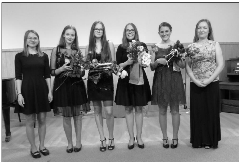
...letošní absolventy a jejich Absolventské koncerty.