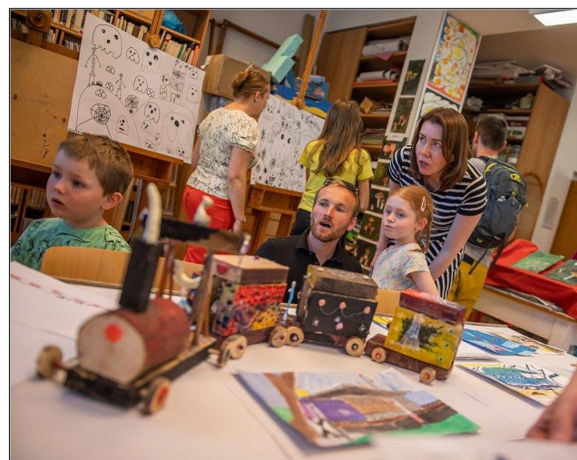
a Den otevřených dveří ve výtvarném oboru.