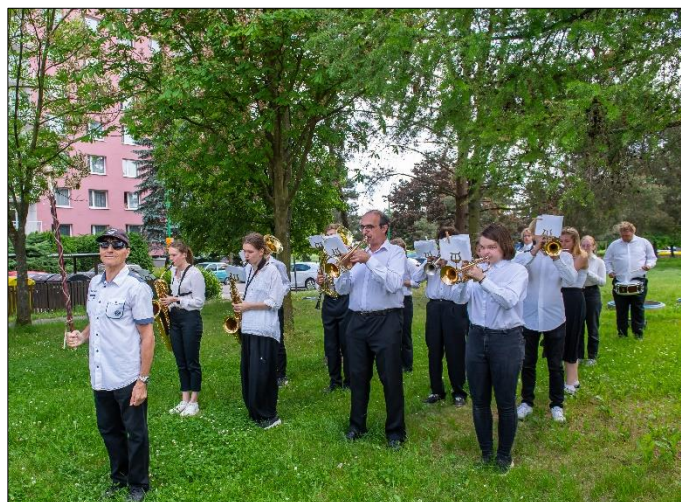
...Brass Orchestra na Zavadičce (ZUŠ OPEN)...