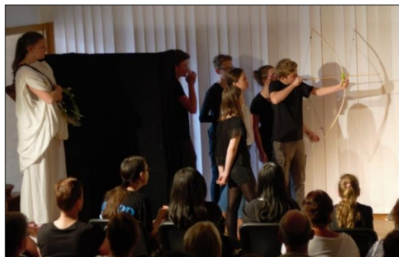
...z Předváděčky dramatařů:

Hejno: „Střílení k ptáku“ 1.ročník: „Pojďme hledat poklady“