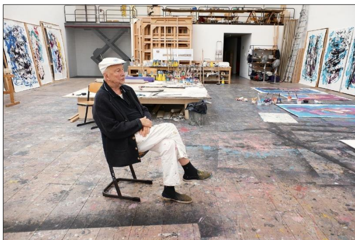
Georg Baselitz ve svém ateliéru

Georg Baselitz - Drinkers & Orange Eaters - Publications - Skarstedt Gallery