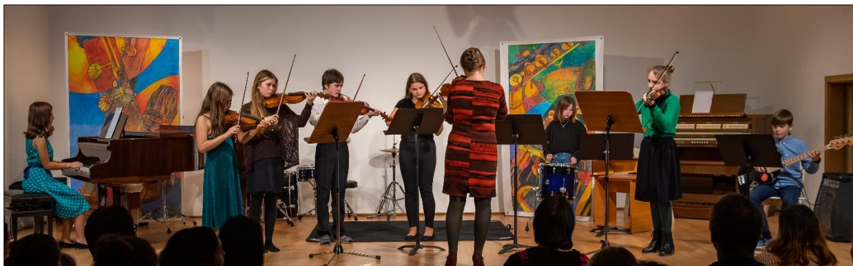
a Mladé smyčce na Vánočním koncertě v ZUŠ.