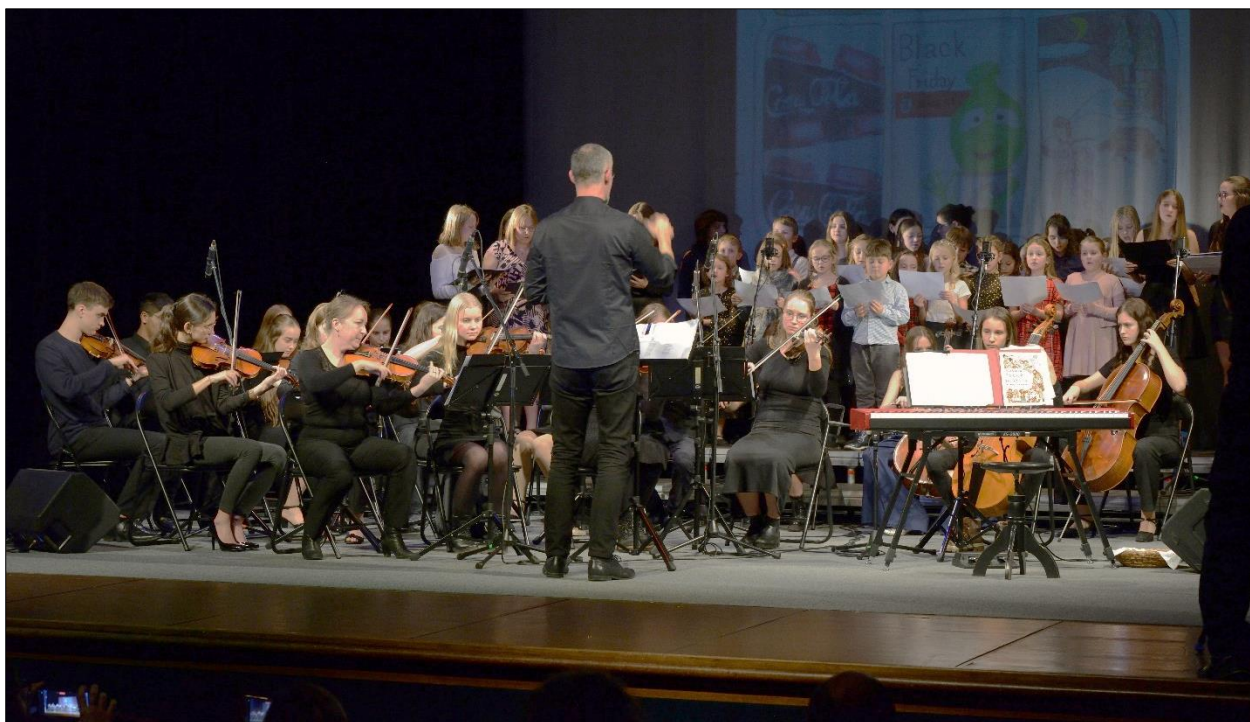
komponovaný pořad „České Vánoce; Jaké budou ty vaše?“ (video záznam pro účinkující už brzy!)