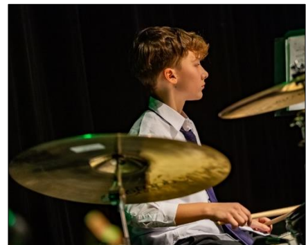
...a Novoroční koncert Brass Orchestra a rockové kapely SUDY v Městském divadle v Jaroměři.