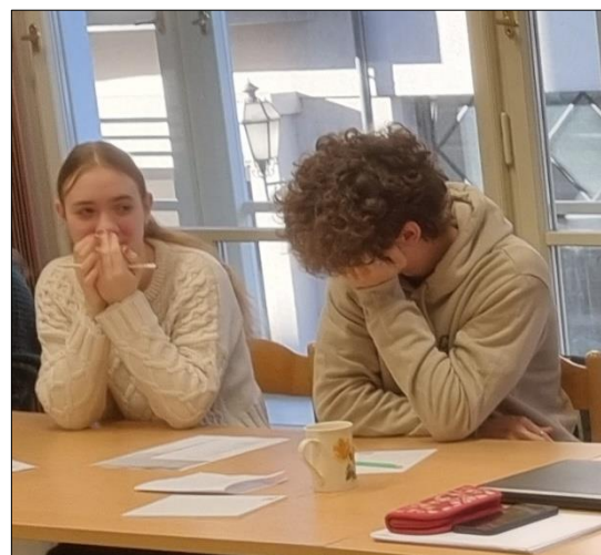
...na semináři o přednesu...