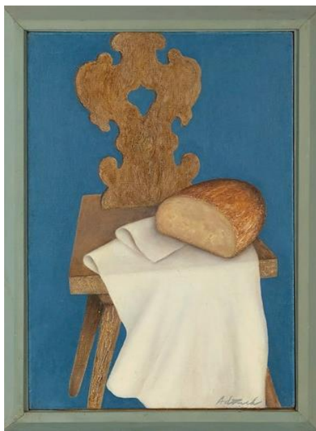
Miroslav Adámek: Chléb (zátiší)