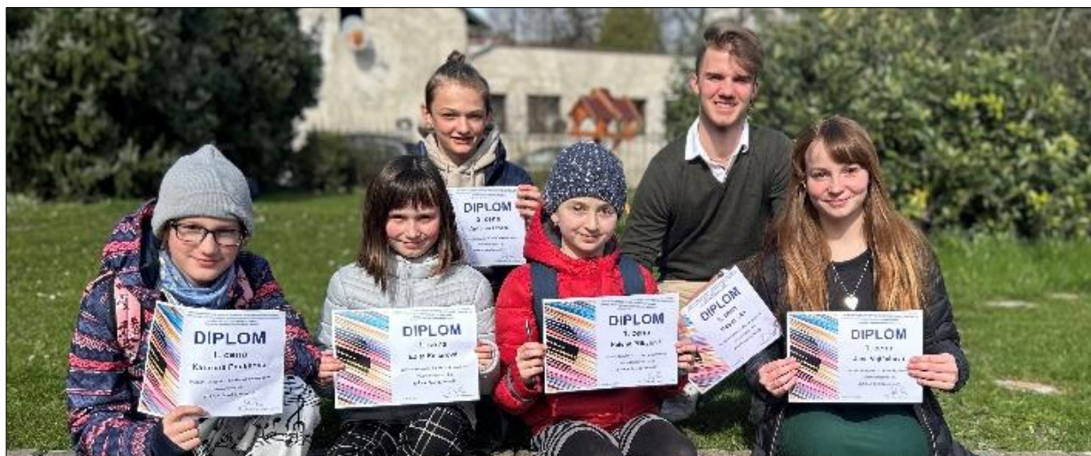
naše kytarová reprezentace z okresního kola soutěže ve hře na kytaru

Pevně zdraví a nikdy nekončící údiv nad vším krásným Vám přeje Váš Vlastimil Kovář.