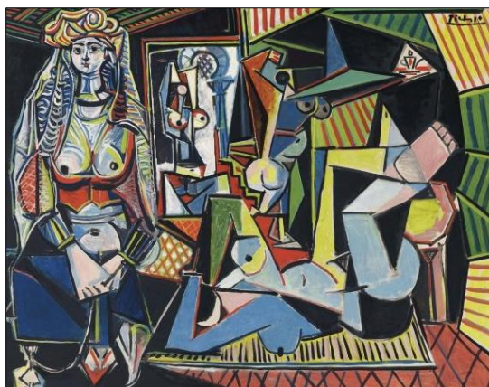
Alžírské ženy (1955)