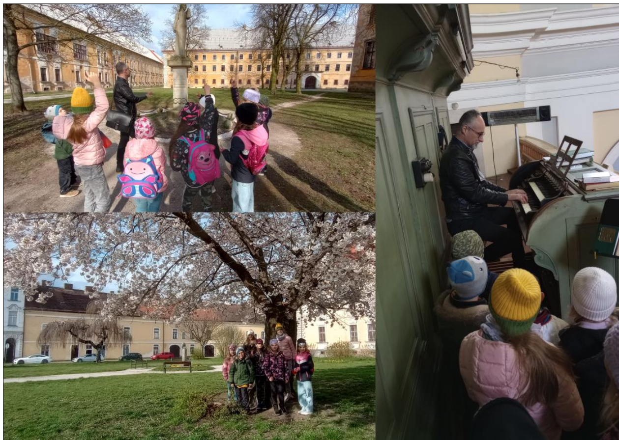
...výtvarníky v Josefově...