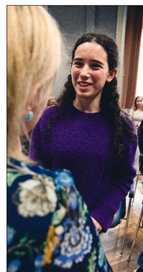
a Popcorn v krajském kole Wolkrova Prostějova.