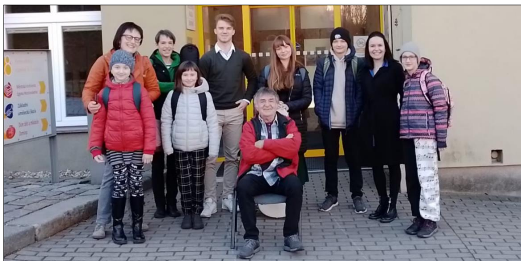
...naše kytaristy v Hronově...