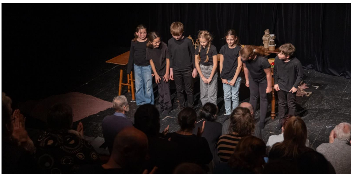
...soubor Překvapení při děkovačce v Galaxii v Praze...