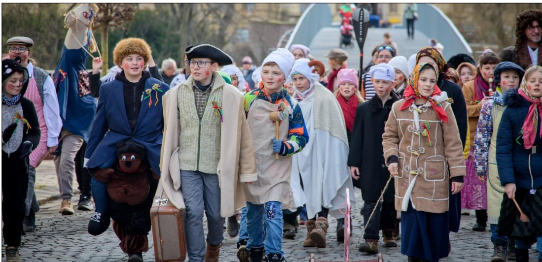
z loňského Masopustního průvodu v Jaroměř

První měsíc za námi a nový opět před námi. Pomalu můžeme vyhlížet první známky jara, protože všichni víme, že únor je měsícem nejkratším. A má i své charakteristické znaky, mezi které lze zařadit masopust, svátek masek a veselí, Hromnice, se kterými se váže mnoho pranostik či Valentýn neboli svátek zamilovaných, ač pochází z Ameriky, tak už je i u nás populární. Pokud by vás zajímalo odkud název druhého měsíce v roce pochází, museli byste dobrou chvíli přemýšlet. Údajně je odvozen ze slova „nořiti se“, což souvisí s únorovým táním ledu, kdy se na řekách ponořují ledové kry pod vodu. Z hlediska historie se k únoru dozajista váže rok 1948. Únorový komunistický statní převrat v tehdejší Československu započal přechod demokracie k totalitě. Je důležité si uvědomit, právě díky těmto událostem, že ač se nám to možná nemusí vždy tak zdát, stále se máme dobře. Minimálně žijeme ve svobodné zemi, kterou neovládají komunisté. Zajímavým dnem je také 12. únor, Darwinův den, kdy se roku 1809 narodil Charles Darwin, britský přírodovědec a zakladatel evoluční biologie. Jeho dílo „O vzniku druhů přírodním výběrem“ způsobilo doslova poprask. Mimo jiné proto, že v něm poprvé zazněla myšlenka, že se člověk vyvinul z opice. Sice máme před sebou nejkratší měsíc v roce, ale určitě o něm nelze říct, že by byl méně zajímavý než ostatní. Určitě neztrácejte optimismus ze sychravého počasí, protože teplé dny jsou již na dosah. Viki