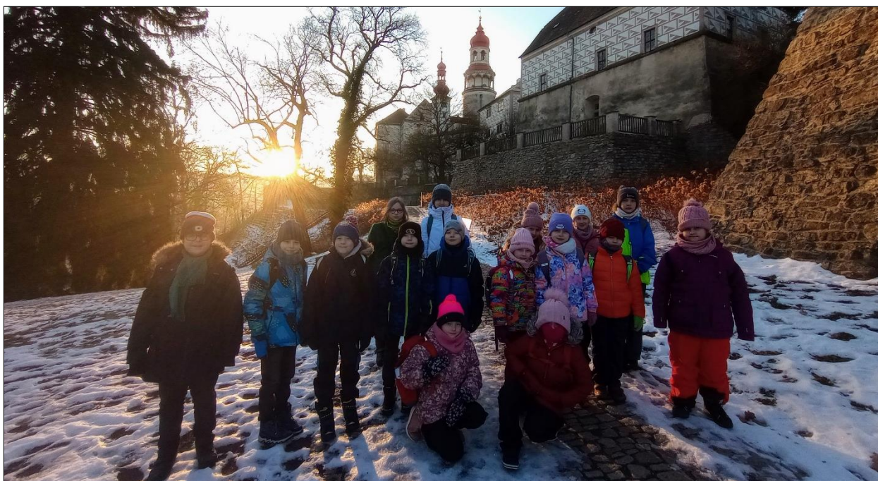
...výtvarníky v náhodské Galerii...