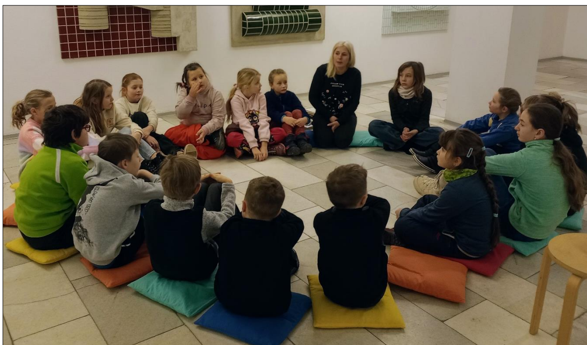
výtvarníci v Galerii v Náchodě