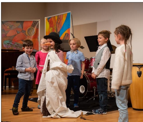
Děti z Hudební přípravy C se loučily se zimou a vítaly jaro