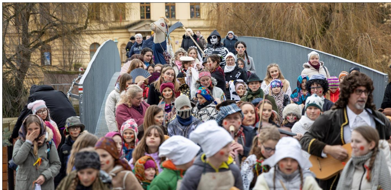
Masopustní průvod v Jaroměři