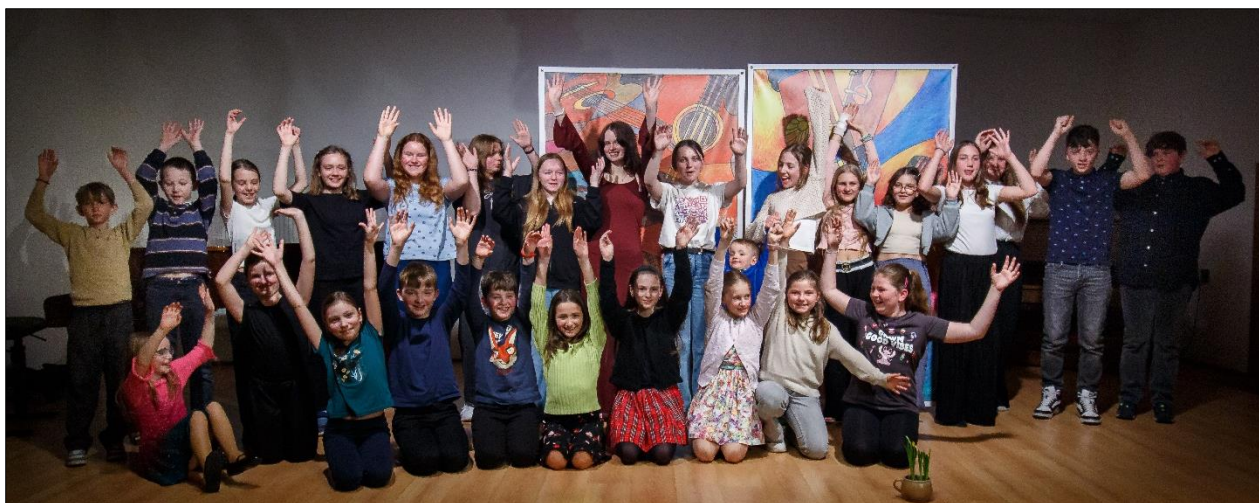
At' žije přednes!